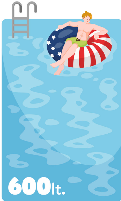
Pileta pequeña (América)

Observa la siguiente infografía. Identifica en qué áreas del planeta las personas tienen acceso a más o menos litros de agua potable.